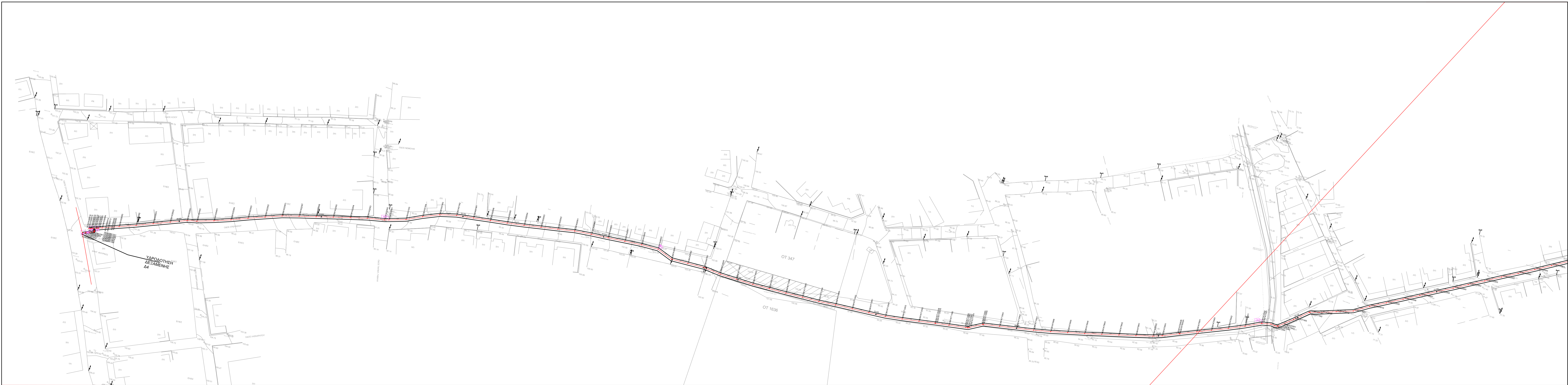
ΟΡΙΖΟΝΤΙΟΓΡΑΦΙΑ ΚΑΙ 1:1000